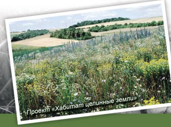
Проект «Хабитат целинные земли»